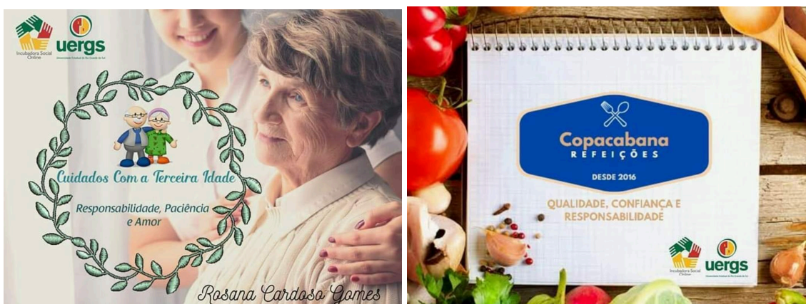
Imagem 1 - Imagens do Instagram